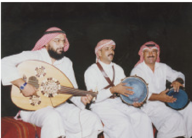
Bild oben: eine Dhabka-Tanzgruppe tritt auf und präsentiert ihre Tänze.

Es wird gefeiert nach traditionell beduinischer Art. Es wird gesungen, getanzt und natürlich ist auch gut für's leibliche Wohl gesorgt.