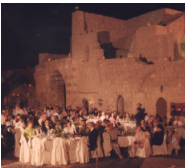
Bild links: "Lawrence Soirée" mit Konzert und Gala Dinner im Kastell von Aqaba am 3. Tag des Events.