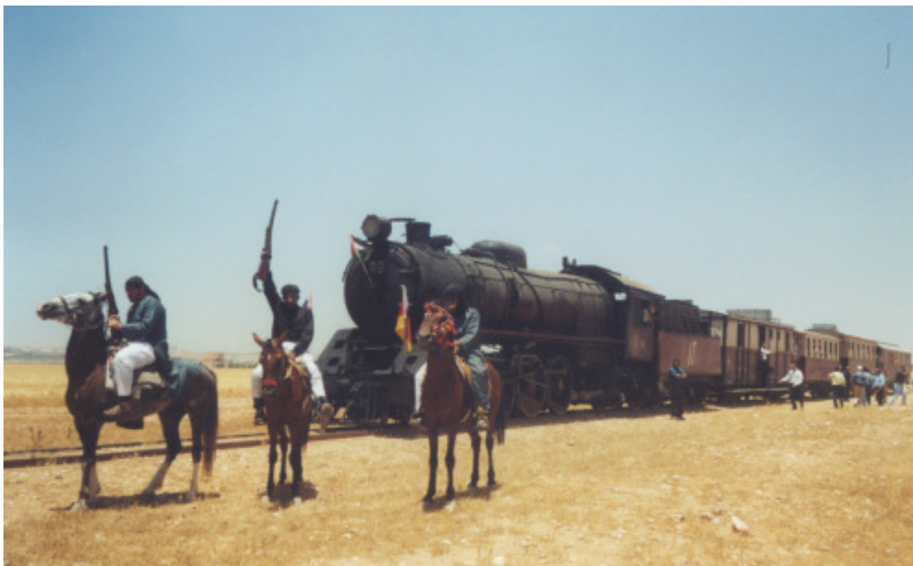
Ein inszenierter Beduinenüberfall, als lustige Unterbrechung der Dampfisenbahnfahrt.