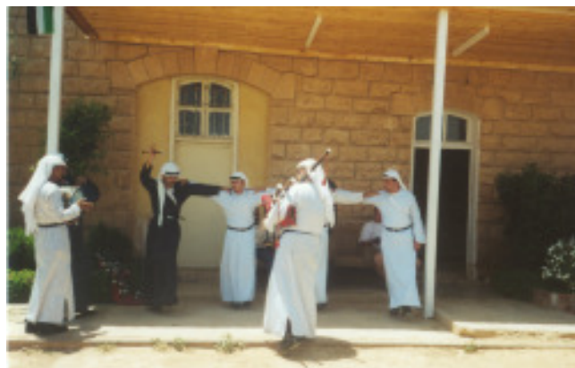
Eine traditionelle Dhabka Tanzgruppe empfängt die Gäste am Bahnhof in Jiza.