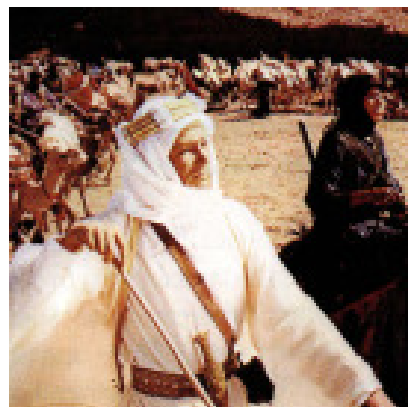
Peter O'Toole in der Hauptrolle als "Lawrence von Arabien"