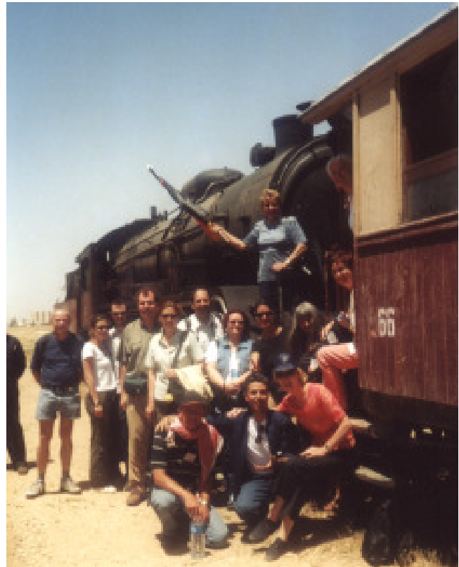
Bild oben: Teilnehmer einer Gruppe am 1. Tag der Reise vor der historischen Hejaz Dampfisenbahn.

Ein Konzert im Kastell von Aqaba, mit anschließendem "Candle Light Dinner" im orientalischen Stil, rundet am letzten Tag des Events die Feierlichkeiten ab.